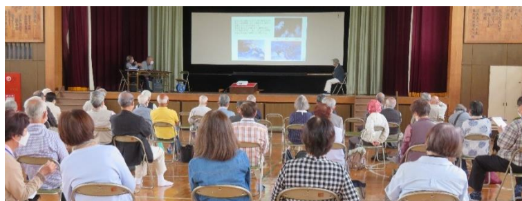
第172回定例会には50人以上が参加

同窓会発足と同時にスタートした歴史クラブ。会員68名の大所帯です。「共助・共学・共楽」を目標に、20年近く活動を続けています。毎月開催の定例会及びテーマ発表、8つのグループ活動、外部講師を招いての特別講座等で学びを深めるほか、年2回の定例見学会を行います。昨年度はコロナ禍で定例見学会が中止になりましたが、会員の勉学への意欲は衰えず、感染対策をすることができる活動を続けています。