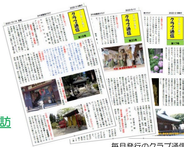
毎月発行のクラブ通信

興味・関心はあっても、一人ではなかなか出かけたり、勉強したりできないけれど、スタッフ中心に計画を立てていただき、楽しく参加させていただいています。出かける時の道中が楽しく、皆さんと親しくなれて嬉しいです。